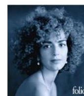
Leila Slimani Le parfum des fleurs la nuit